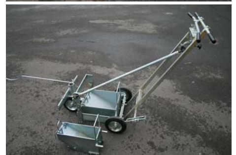
Abbildung zeigt Durozet-5 G inkl. Entleerungsvorrichtung (Zubehör)