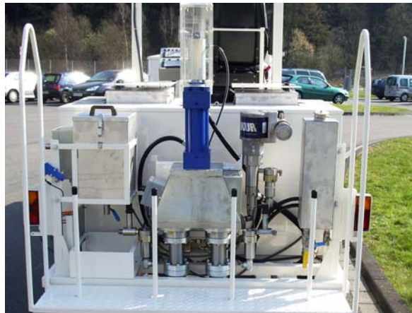
2K-Airless-Aggregat 2/135-250 R Plus mit saugseitiger Härtereinspeisung